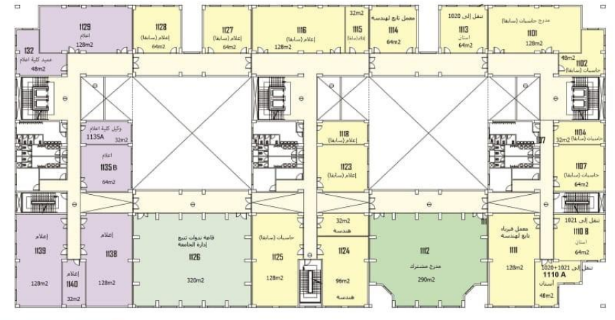
مسطح أفقي للدرج الأول

كلية الهندسة جامعة أكتوبر October 6 University