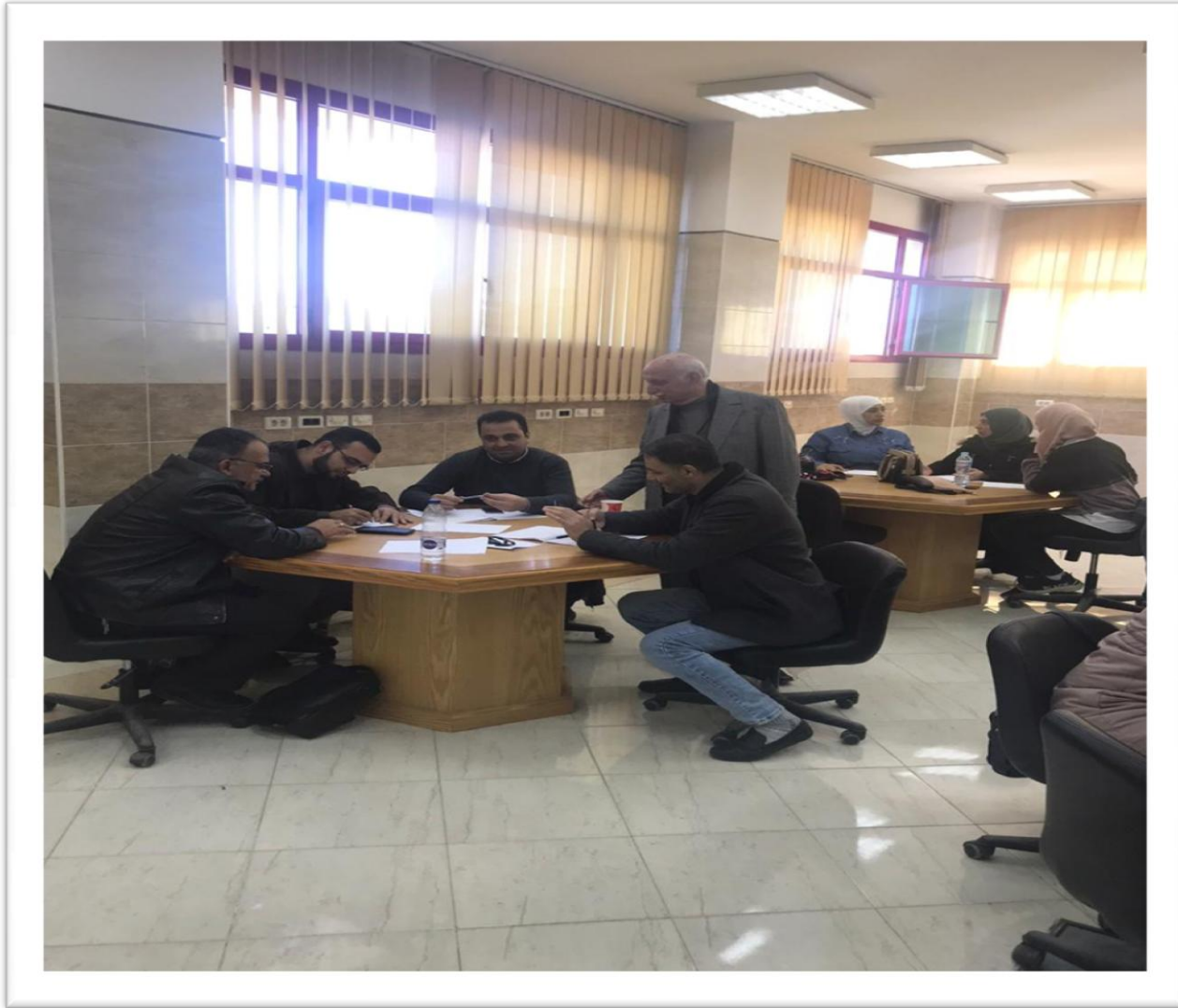
دورة اللاجئين السوريين